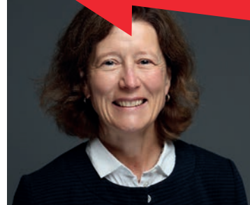
Prof.ssa Dr. Kirsten Müller-Vahl

Il disturbo da deficit di attenzione e iperattività (ADHD) è un disturbo comune con esordio nell'infanzia, caratterizzato dai sintomi principali di iperattività, impulsività e mancanza di attenzione. Spesso ci sono sintomi aggiuntivi come depressione, comportamento antisociale, disturbi della personalità, disturbi del sonno, dipendenza da sostanze e tic. In circa la metà delle persone colpite, i sintomi persistono anche nell'età adulta. Clinicamente, i sintomi più frequenti sono: impulsività, sbalzi d'umore e incapacità di eseguire i compiti.